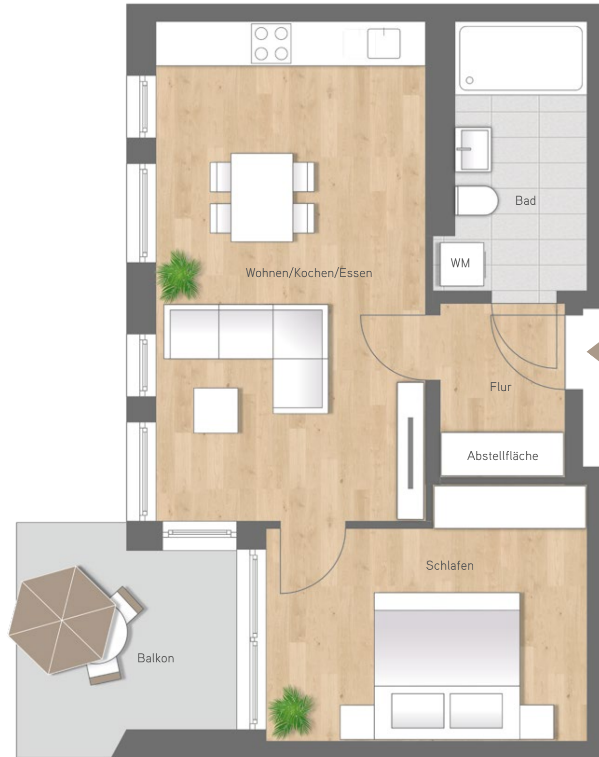
Maßstab ca. 1 : 50

2 Zimmer Wohnung 3.2.9. | 2. OG Wohnfläche 53,96 m 2