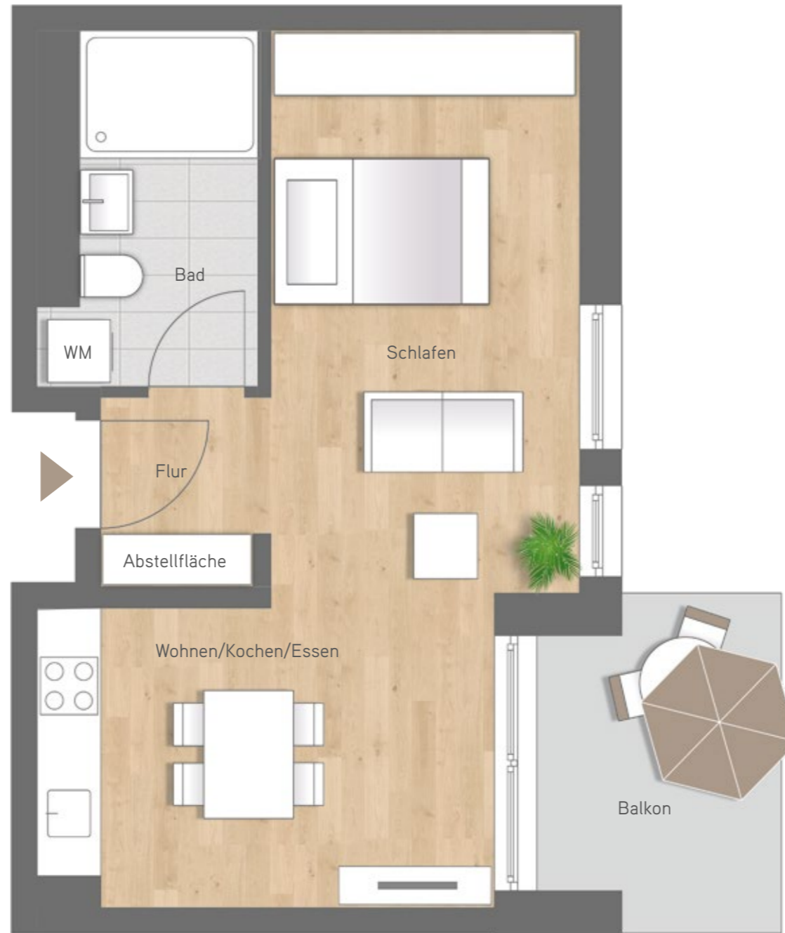
Maßstab ca. 1 : 50

1 Zimmer Wohnung 3.1.5. | 1. OG Wohnung 3.2.5. | 2. OG Wohnfläche 39,63 m 2