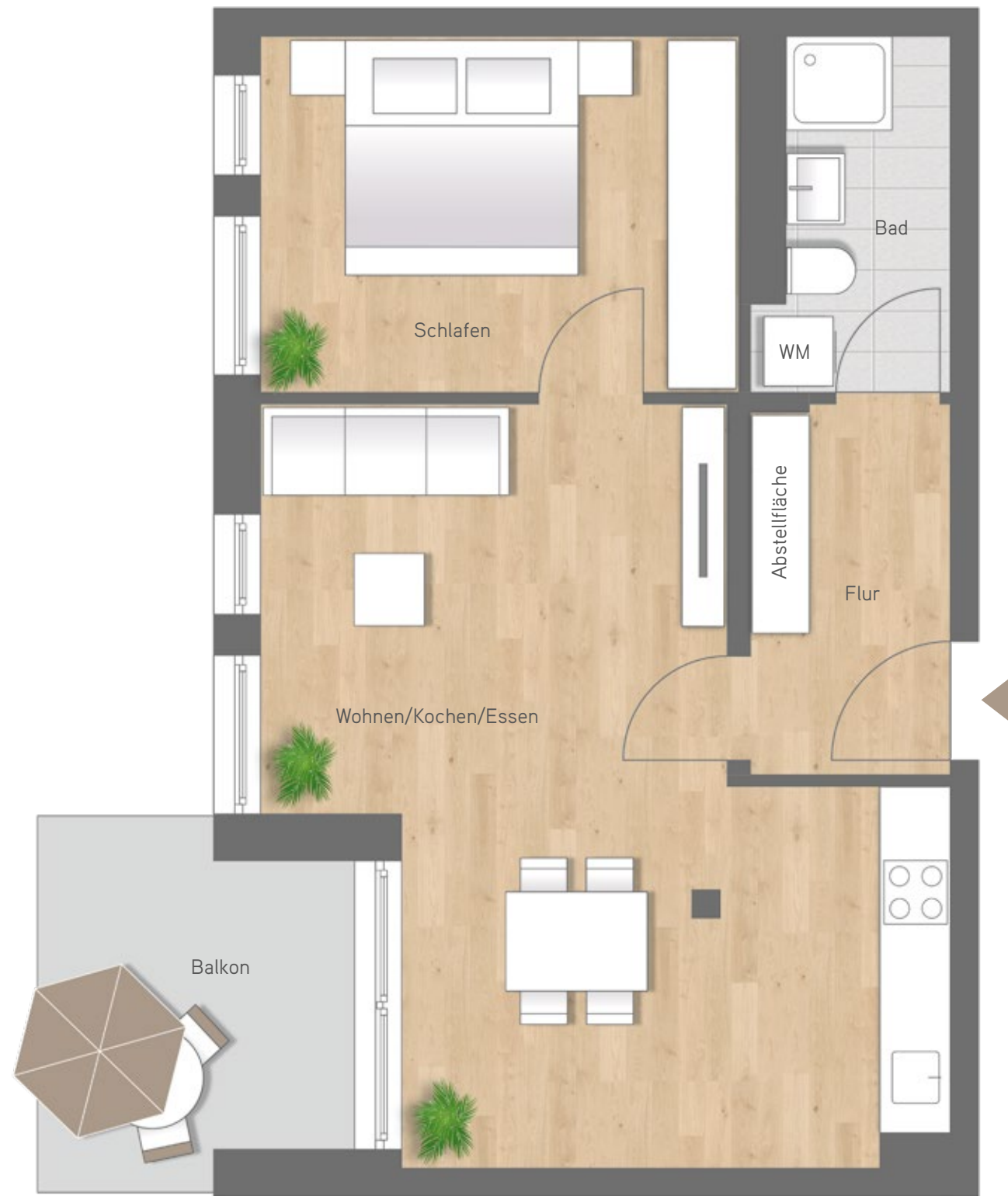
Maßstab ca. 1 : 50

2 Zimmer Wohnung 3.1.11. | 1. OG Wohnung 3.2.11. | 2. OG Wohnfläche 54,21 m 2