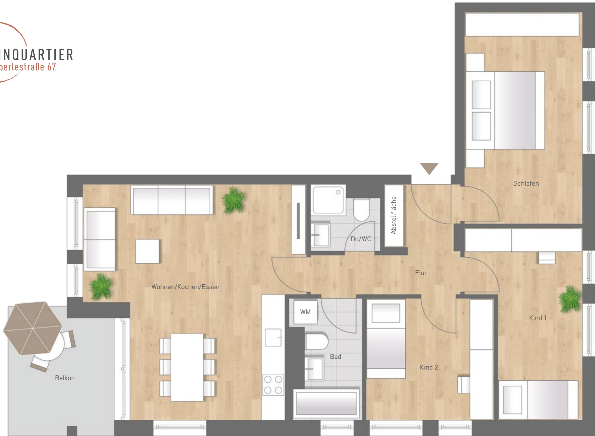
Maßstab ca. 1 : 50

4 Zimmer Wohnung 1.1.1. | 1. OG Wohnung 1.2.1. | 2. OG Wohnfläche 85,80 m 2