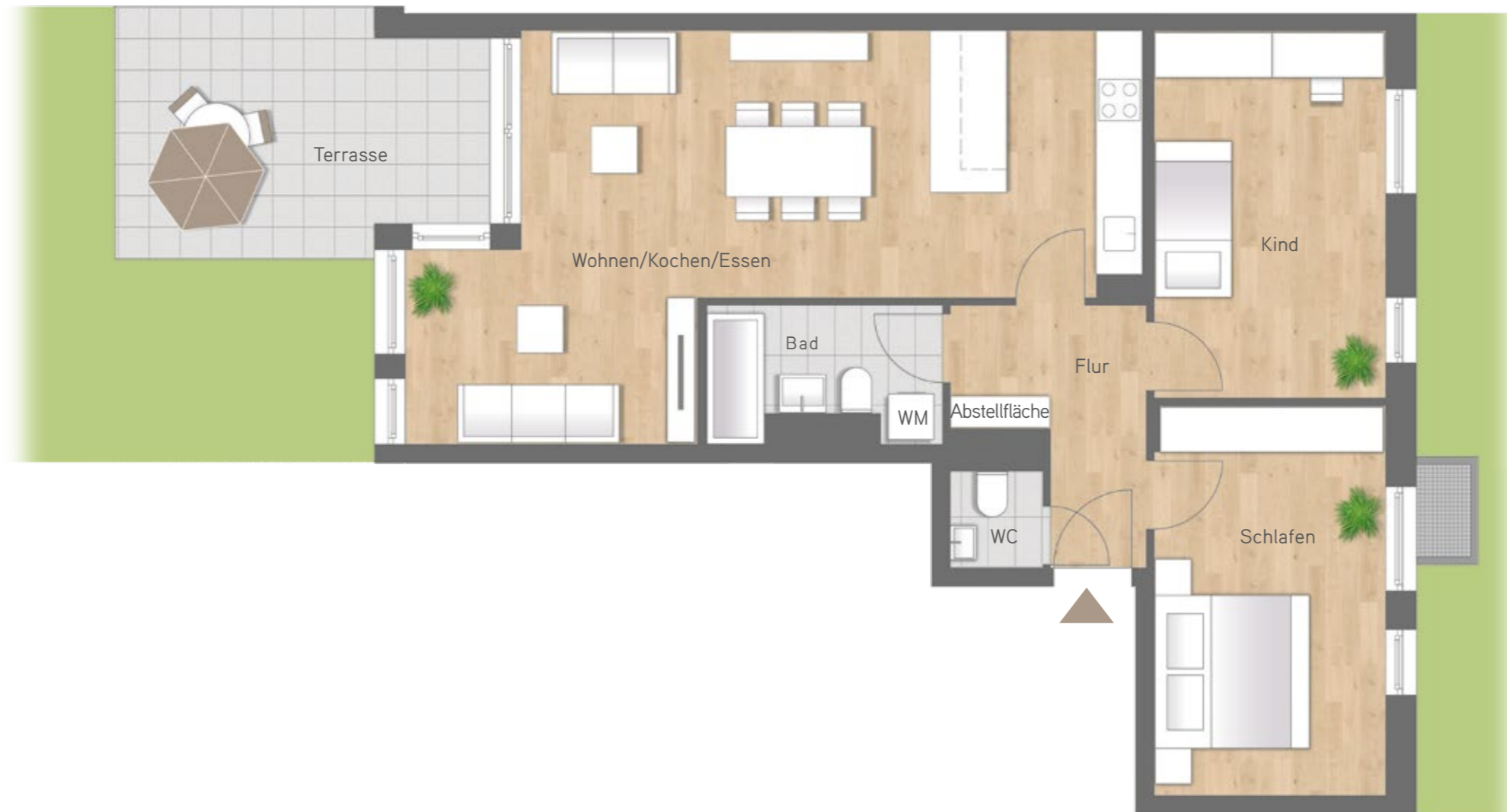
Maßstab ca. 1 : 75